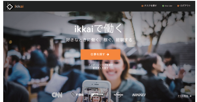
※新しいプラットフォームのスクリーンショット

マーケットプレイスは、プロジェクト型の仕事のマッチングプラットフォームです。掲載費用は完全無料で、かつ依頼者の希望の金額で学生に仕事を依頼することができます。ikkai は、学生がアルバイトではなくフリーランサーとして働く機会を増やし、社会経験の場数を踏んで欲しいと願っています。大手クラウドソーシングサービスでは埋もれてしまう学生の可能性を見出し、伸ばすこと、そして学生が地域社会における活躍の場を増やすことで、日本におけるシェアリングエコノミー（共有経済）を発展させていきます。